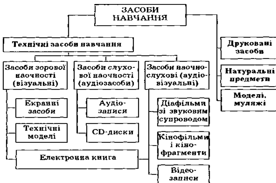
Рис.1 Види засобів навчання

Транспарант є екранним засобом зорової наочності, ефективний завдяки своїм високим демонстраційним властивостям: фронтальності, контрастності, яскравості тощо. Інформацію з екрана учні розглядають емоційно, що сприяє зосередженню їх уваги на об'єктах вивчення, а це важливо для інтенсифікації, підвищення ефективності навчального процесу.